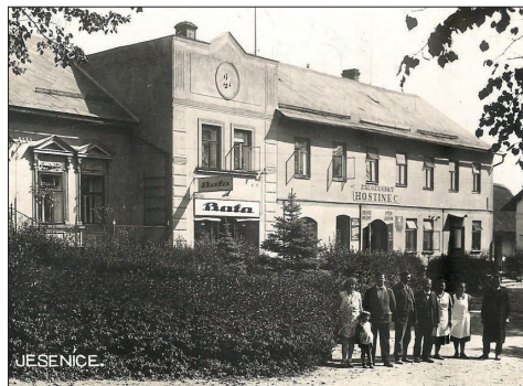
foto ze 30. let 20. století: vlevo č.p. 102 (Záložna), vpravo č.p. 138 (Záloženský hostinec a obchod) – na budově znak JZ (Jesenická Záložna), v pozadí za rohem budovy je č.p. 70 (zbouráno v roce 1940)

Přeji Vám v této nelehké době pěkné jaro a zdraví Vás Jaroslav Zelený